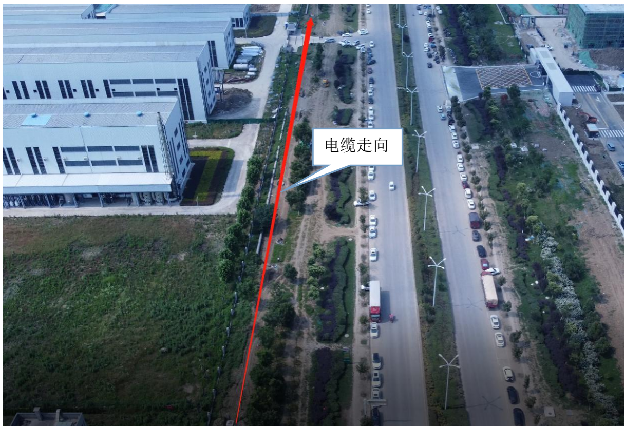
图6-1 本工程航拍图（线路）