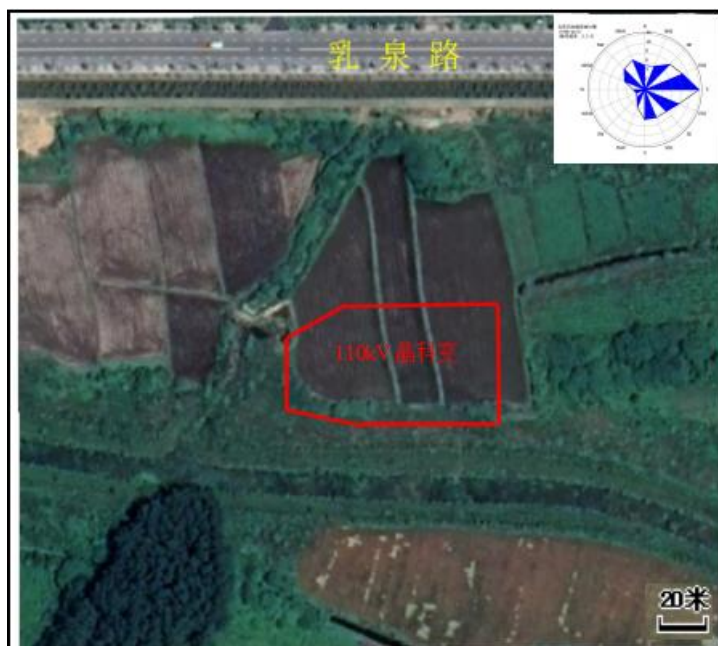
图 4-1 站址地理位置图

本工程位于合肥市肥东县合肥循环经济示范园龙兴大道与乳泉路交口西南侧，选址位于安徽晶科能源有限公司16GW新型高效电池片项目厂界外西南侧，厂界直线距离约342m，站址位置详见下图。