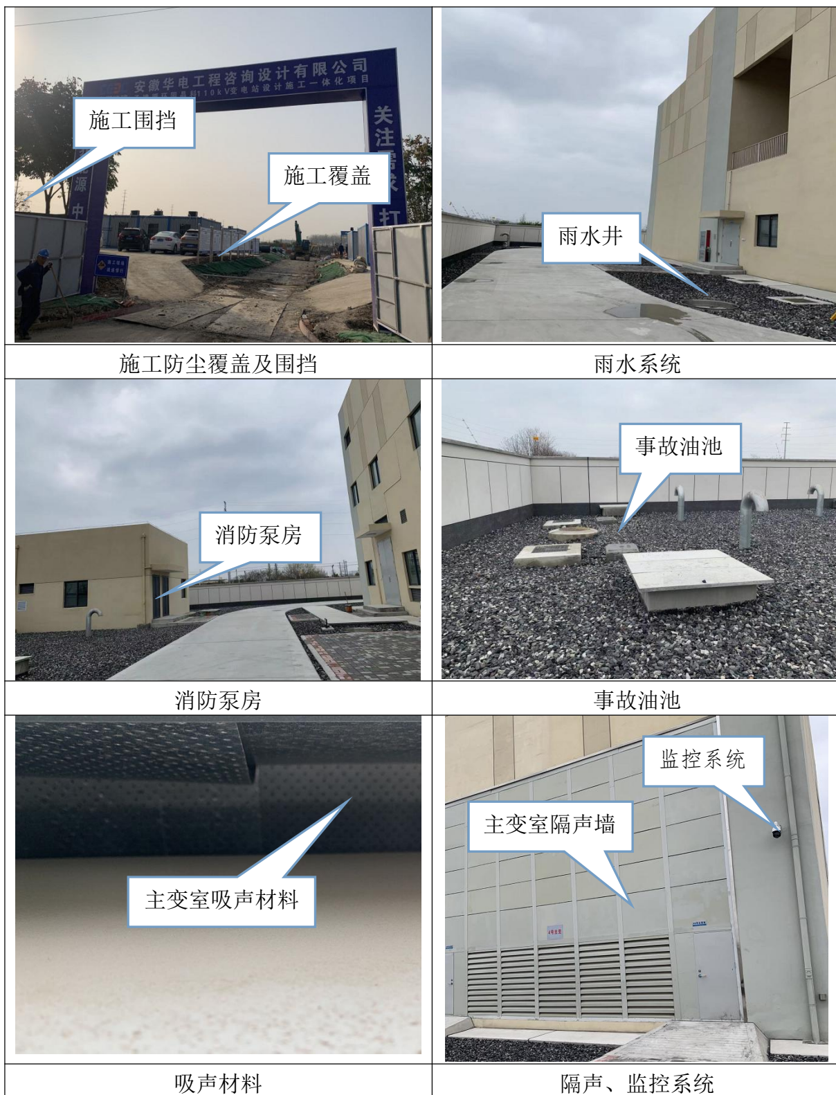
图6-3 本工程现状照片（1）