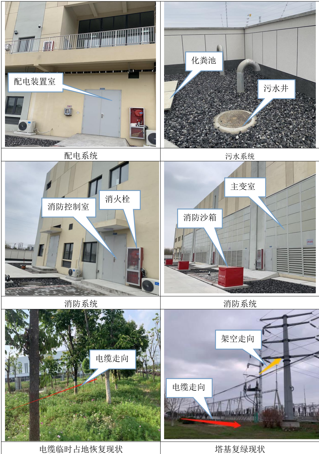
图6-3 本工程现状照片 (2)