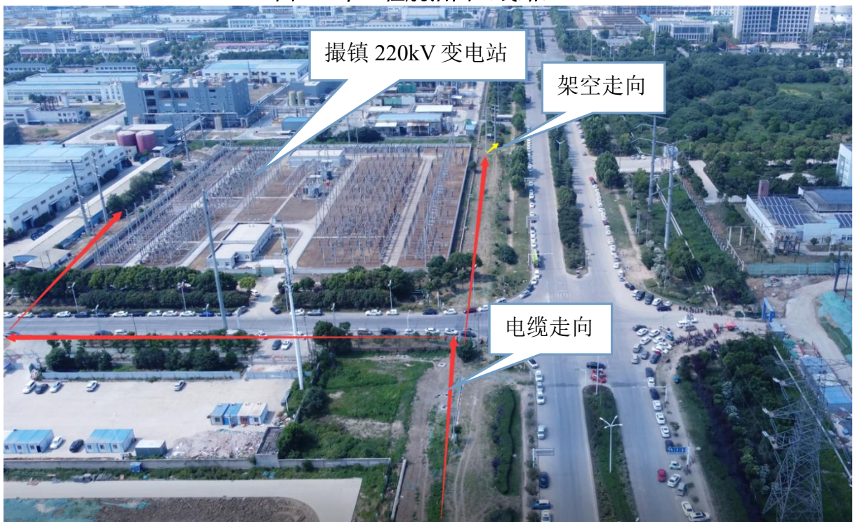
图6-2 本工程航拍图（线路、撮镇变）